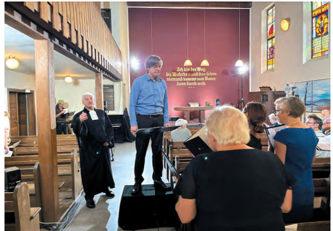
Letzte Proben Sonntagfrüh vor dem Gottesdienst