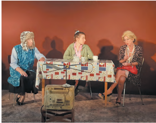
Die Präsidentinnen

Mit gleich zwei Aufführungen im Oktober wurde der Altarraum der Zwinglikirche endlich wieder zur Bühne. Am 7. Oktober fand die Premiere des gewaltigen und denkwürdigen Stücks: „Die Präsidentinnen“