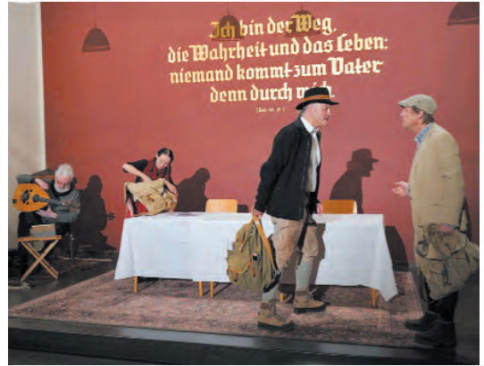
teatro caprile

Eine Woche später war das teatro caprile zu Gast mit einer szenischen Lesung über den Be-